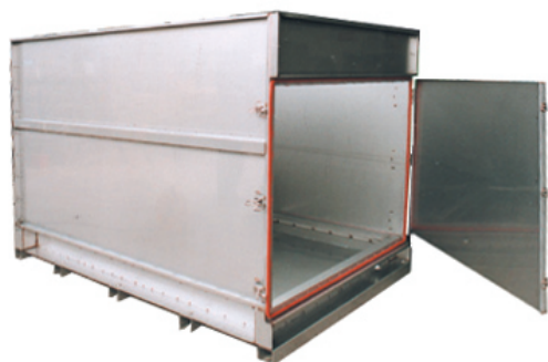
ステンレス槽 (内部合板内張) 写真は試作モデルです。